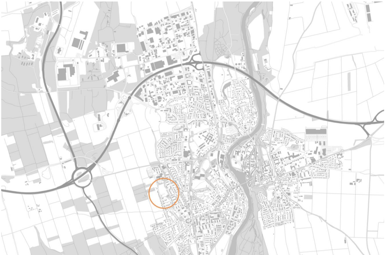
Abbildung 1: Lage im Stadtgebiet

Planfertiger: Stadtplanung und Umwelt, Referat 45