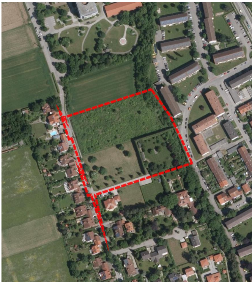
Abbildung 2: Luftbild mit Geltungsbereich